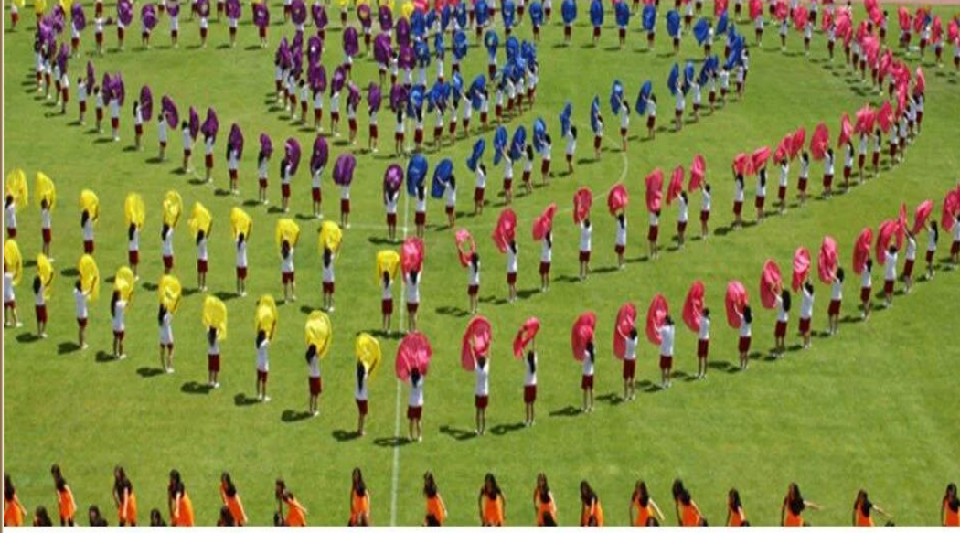
29 Ekim Cumhuriyet Bayramı.